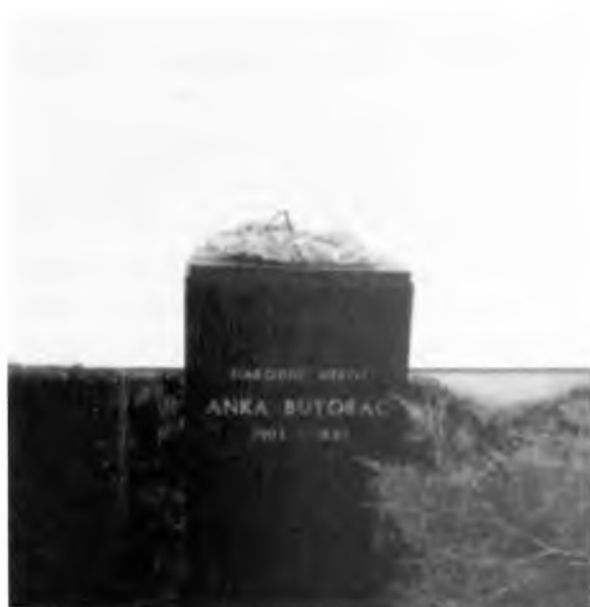
sl. 574 a

Na raskršću putova podignut je spomenik s likom partizana s puškom u rukama. Na spomeniku su bile mramorne ploče s imenima 45 palih boraca i 53 civilne žrtve. Spomenik je oštećen.