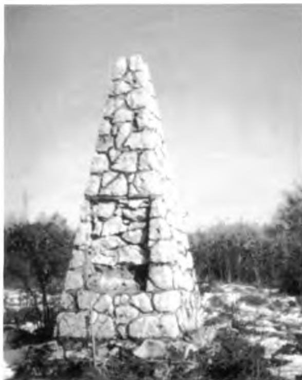
sl. 572 a

- Donji Kuruzari , u selu oštećen je spomenik podignut palim borcima i civilnim žrtvama fašizma (sl. 572 b).