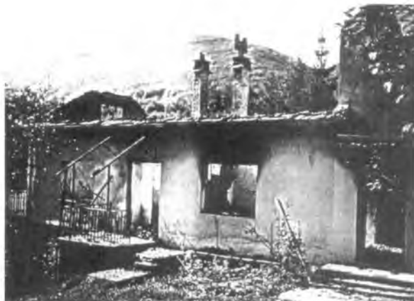
sl. 294 a

Među tisućama porušenih i spaljenih stambenih i gospodarskih zgrada uništeno je i desetine zgrada koje su za povijest Like imale spomeničku vrijednost. Jedna od takvih zgrada je bila i kuća Dušana Vojvodića u Neteki u kojoj je održan prvi partijski sastanak i dogovoren ustanak stanovnika sela u srpnju 1941. godine. (slika 294 a)