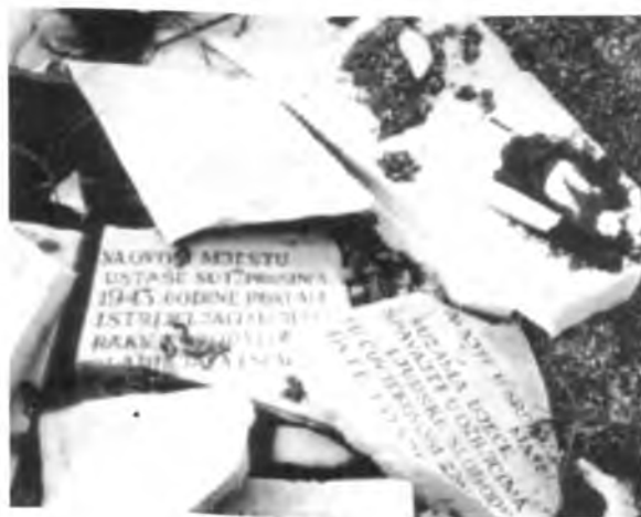
sl. 573 c

- U ustaničkom mjestu Svinica , podignut je nakon pobjede nad fašizmom veliki spomen-dom, na kome su bile mramorne ploče s imenima, prezimenima i godinom starosti (69 palih boraca, 156 žrtve fašizma, među njima je 36 djece mlađe od 14 godina). Ispred doma su bile biste narodnih heroja Živka Bronzića i Simice Dragića. Dom je opustošen, biste odvaljene s postolja, nestale, a mramorne ploče izbušene mecima (sl. 573 d)