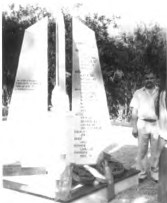
sl. 573 b

Stanovnici Slabinje podigli su uz to i spomenik u središtu sela blizu zidina srušene pravoslavne crkve kao znak sjećanja na 17. prosinac 1943. godine, kad su jasenovački ustaše iznenada opkolili selo i svih 96 stanovnika koje su u selu uhvatili (žene, djecu i starce), istog dana likvidirali vatrenim oružjem i klanjem nad zajedničkom grobnicom koju su žrtve prije pogubljenja same sebi iskopale. (sl. 573 b). Ovaj spomenik je poslije 1995. godine srušen do temelja, a mramorne su ploče s popisom žrtava i tekstom posvete razbijene (sl. 573 c)