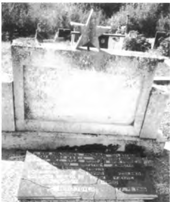
sl. 572 c