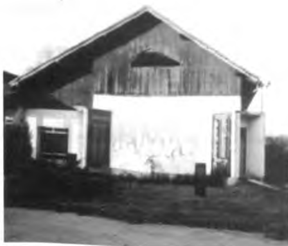
sl. 573 d

- U ustaničkom mjestu Svinica , podignut je nakon pobjede nad fašizmom veliki spomen-dom, na kome su bile mramorne ploče s imenima, prezimenima i godinom starosti (69 palih boraca, 156 žrtve fašizma, među njima je 36 djece mlađe od 14 godina). Ispred doma su bile biste narodnih heroja Živka Bronzića i Simice Dragića. Dom je opustošen, biste odvaljene s postolja, nestale, a mramorne ploče izbušene mecima (sl. 573 d)