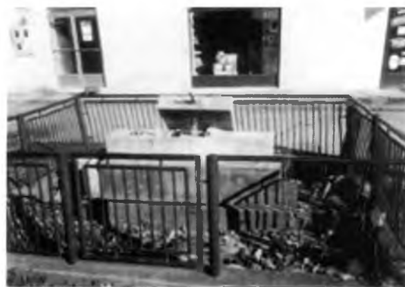
sl. 572 b