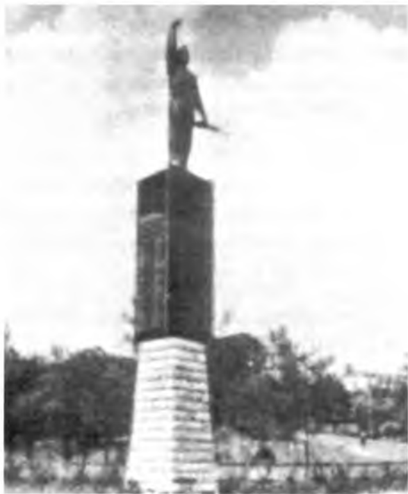
sl. 592 a

Na mjestu srušenog spomenika izgrađena je katolička crkva." (sl. 592 a i 592 b)