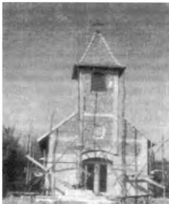
sl. 592 b

Na istoj strani lijevo pod tekstem: "U Petrinji ..." umjesto točke treba staviti zarez i dodati riječi: "a pred ulazom u bivšu kasarnu bila je bista narodnog heroja Vasilja Gačeše."